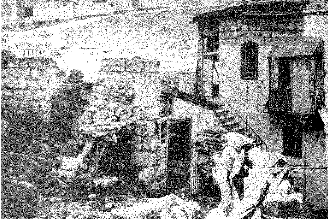
ממראות המלחמה בירושלים בתש"ח-1948

העמוד הראשון: "תחי מדינת ישראל העצמאית!" ותחתה מאמר מערכת, "הכרזת המדינה היהודית בארץ-ישראל". כל העמוד הראשון הוקדש לנושא זה. כאחת הידיעות נמסר, שמיניסטריין התעשייה נענה בחיוב לפנייתו של הוועד המרכזי לרכוש מוצרים פולניים בעד כל סכום המגבית שהוכרזה על-ידי הוועד, למען ישראל הלוחמת. הסתורות יישלחו לישראל באניה מיוחדת.